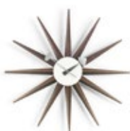
Sunburst Clock, Nussbaum, Ø 470