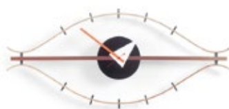
Eye Clock, Messing/Nussbaum, H 340 x B 760