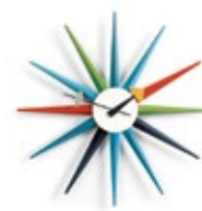
Sunburst Clock, mehrfarbig, Ø 470