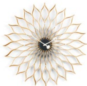
Sunflower Clock, Birke, Ø 750