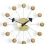
Ball Clock, Kirschbaum, Ø 330